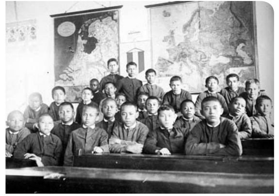
De Pupillenschool in Gombong (Midden-Java), voor de opleiding van "kinderen van het mannelijke geslacht voor de militaire stand". De foto is afgebeeld in Baren en oudgasten , een deel uit de fotoboekenserie Tempo doeloe – een verzonken wereld (uitgeverij Querido), samengesteld door Rob Nieuwenhuys.

Het gebrek aan kennis in de Nederlandse samenleving over de Indische cultuur en geschiedenis is een doorn in het oog van veel (Indische) Nederlanders. Ervaringsverhalen uit de Indische gemeenschap worden door gebrek aan voorkennis niet altijd in de juiste context geplaatst waardoor de beeldvorming blijft steken in clichés.